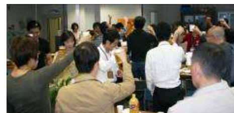
笑いの絶えない懇親会となりました

交流会終了後は同じくサロン・ド・ゆきみーるで懇親会を開催。「茶店ギャラリー野の花」さんの料理を頂ながら皆で盛り上がり、話が弾みました。