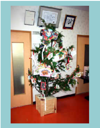
利用者の思いが詰まった 「破魔矢ツリー」

移動制約者を対象とした福祉移送サービスを早くから行なうなど先駆的な活動を実施。2002年に法人化。現在は子どもサロンも運営中。島根県浜田市三隅町。事務局長のブログはこちら→ http://blog.canpan.info/ainokai2009/