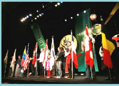
第3回八雲国際演劇祭の様子

いう人も多い。民泊等の協力をお願いしても「関わりたくない」と断られたりもした。それでも根気強く「国際演劇祭はまちづくりに繋がる異文化交流」であることを説明し、徐々に町民の賛同を得ていった。