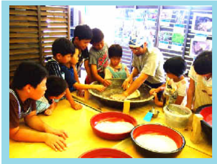
みんなでそば打ち体験!

島外からIターンし、隠岐の魅力を発信しようという若者たちで平成17年に発足させた任意団体。金山寺山都市農村交流センターを拠点に、宿泊施設の運営、エコツーリズムの推進など様々な活動を行う。隠岐郡海士町。