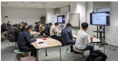
▲セミナー受講の様子（松江会場）

NPO法人の法務、会計・税務、労務に関する知識を1日で学ぶ「全国一斉オンラインNPO事務局セミナー&検定」を開催しました。島根会場は、松江と浜田の両会場ともに多くの方が参加され、疑問点を講師に質問するなど、熱心に取り組まれました。次回は夏頃に開催を予定しています。セミナーのみの受講も可能なので、お気軽に参加いただき、NPO事務力向上にご活用ください。