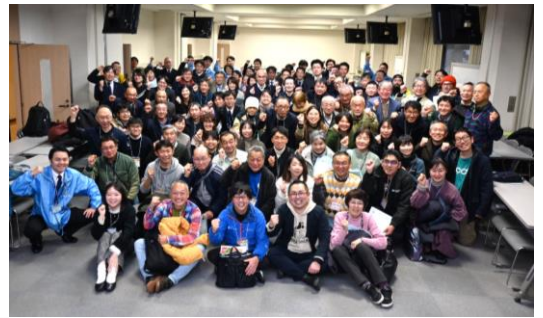
▲全員集合！熱気あふれる祭となりました

当日は防災、地域交通、学生との取組み、関係人口など10テーマの分科会を設け、参加者は自由に選び会場へ。自らの活動に取り入れよう！と質疑や交流が活発に行われました。今後もこのような、学びつなげる機会を設けていきます。