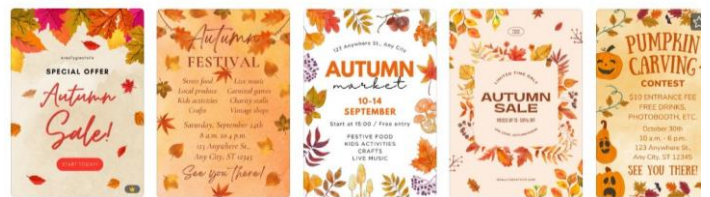
▲ 豊富なテンプレート