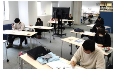
▲セミナーの様子（松江会場）