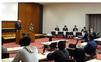
▲NPOネットワーク出雲 設立総会の様子

10月25日、出雲市役所にて「NPOネットワーク出雲」の設立総会が行われました。出雲市内のNPO法人が、活動分野を超えて学び合い、親睦を深め、スキルアップすること、そして行政と協働し暮らしやすい出雲市の実現に向けて、第一歩を進められました。