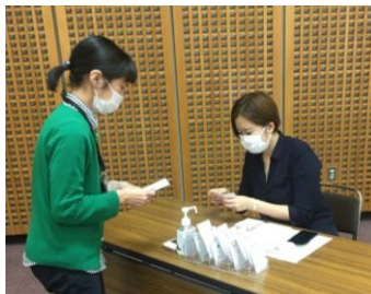
（プロジェクトを重ねるゴールを目指す）

カードには、地域資源、お金、施策が記され、資源やお金、情報を交換しながら、プロジェクトを実行。それぞれのプロジェクトを重ねながら、個人のゴールの達成を図り、続いて全員で、地域のゴール達成を目指していきます。