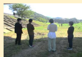
▲キャンプ予定地の現場確認