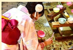
▲金魚すくいをする来場者