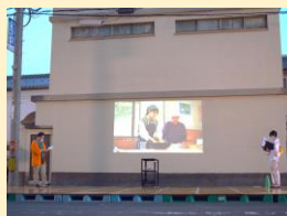
▲しらかた楽市特設ステージ

松江市市民活動センターで開催された「しらかた楽市0725 夏祭りごっこ」に参加しました。今回は4月に実施した資料配布に加え、島根県内で提供される様々な田舎体験を紹介する「いな活動画」を放映しました。コロナ禍ではありますが、小規模であっても地域のイベントに参加することの意義を再確認しました。これからも田舎ツーリズムを通じて、魅力的な体験を多くの方に届けていきます。