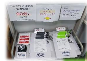
▲健康チェック シートの記入