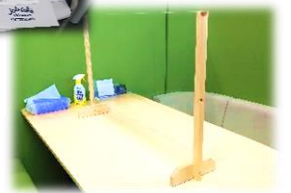
▲アクリル板の設置