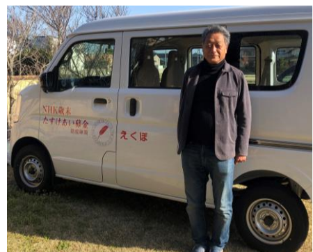
助成金で手に入れた車と共に♪

A 一番力を入れる部分は、「効果」「成果」を意識すること。そして、今までやったことではなく、新しいことを追加すること。