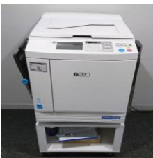
※用紙は各自ご持参ください