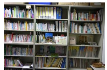
※貸出期間は 2 週間