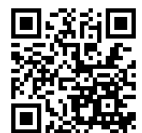
▲『しまねいきいきねっと』バックナンバー

この度、令和 3 年 4 月以降は、2 か月に 1 度の発行に変更させていただきます。になりました。“フレフレしまね”内でも、『しまねいきいきねっと』はご覧いただけます。