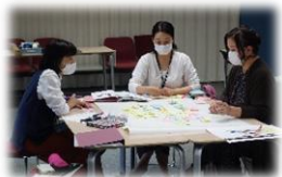
ファンドレイジングの具体的なアイデアを話し合います。ピラミッドを見ながら、どんなことができるのか、知恵を絞ります。