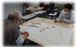
ステークホルダーピラミッドの作成中。 模造紙と付箋を使って、グループ内で見える化。