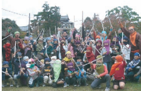
お父さんといっしょに「忍者ごっこ」

1973年、本物の舞台芸術鑑賞をとおして子どもたちの心身を豊かに育みたいと、地元の教員・母親らにより設立。1999年、県内2番目のNPO法人として認証される。舞台劇・人形劇の公演や、キャンプ・異年齢交流など精力的に活動している。松江市末次本町