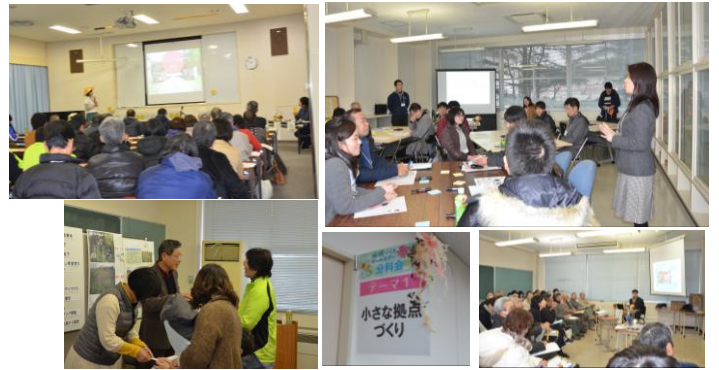
▲昨年の分科会の様子