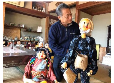
▲人形劇「どじょうすくい」の人形

音楽療育活動、子育て支援活動、人形劇の3本柱で活動。「いつでもどこでも」を合言葉に、県内の老人ホームや保育園、地域サロンなどでライブ活動や人形劇を行う。地域イベントへの参加にも積極的に子供会等でのモノづくり体験などにも力を注ぐ。メンバーは現在42名。