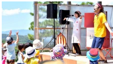
▲紙芝居ライブの様子