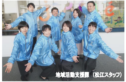
地域活動支援課 (松江スタッフ)

平成31年度の地域活動支援課(松江)は昨年と同様、お馴染みメンバー8名です。全員一丸となって、地域の皆さんを応援していきます！ 本年度も、どうぞよろしくお願いします。