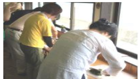
▲アカモクの調理体験

※第3回目の県内研修会は、8月21日（火）、漁家民泊 海宝丸にて「遊漁船と民泊」をテーマに開催を予定しています。