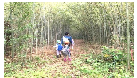
▲里山の毎日は発見の連続