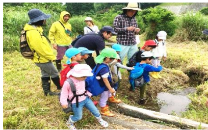
▲山感日（さんかんび）の様子

平成29年特定非営利活動法人里山子ども園わたぼうし設立。里山保育、自然保育の一般化を目標に活動している。 平成30年4月に設立された「しまね自然子育てネットワーク」の副会長も務める。これから活動は本格化していく。