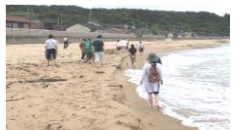
▲琴ヶ浜ヘルスウォーキング

しまね田舎ツーリズムポータルサイト「おいでよ！しまね」も是非ご覧ください。（ http://www.oideyo-shimane.jp ）