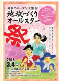
木田暮らしの学校 島根県浜田市旭町木田 485