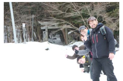
▲「G0 ▶ つくる大学」講座の一コマ