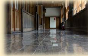
雑巾がけされた廊下はピカピカ☆

3月4日、浜田市の木田暮らしの学校に187名が集いました。木造校舎の温もりを感じる、素敵な空間で「地域づくりオールスター祭」が開催され、木田地区の皆様の全面協力もあり大盛況でした。写真で会場の様子をお届けします。