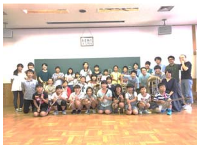
▲キッズミュージックスクール

平成23年4月設立。ふるさとキャリア教育、ビジネスプランコンテストなど行う。平成27年「第5回地域再生大賞」大賞受賞。現在は江津市複合施設「ばれっと江津」の指定管理を受ける。平成30年春、行政と一緒に「つくるG0 ▶ つくる大学」を開校。