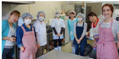
スイーツ講座でオーストラリアの方とも交流

この先もずっと、地域みんなが元気に暮していくために、困ったことがあったとしても、なんでも「みんなに相談」し「やってみよう」との心意気で挑戦してみる。そんなところに団体運営のヒントがあるので、と感じながら工房を後にした。(M)